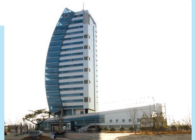
▲ 광양 월드마린센터 전경(2009년 상반기 물종합기술연찬회 장소)