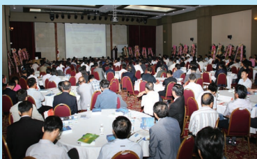
▲ 2008년 하반기 연찬회 이병욱 차관 특강 장면(제천 청풍리조트)