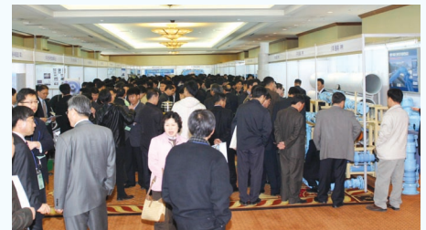
▲ 2008년 상반기 연찬회 전시회 장면(강원랜드)