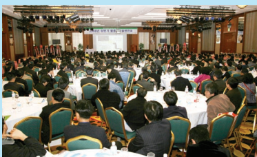
▲ 2008년 상반기 연찬회 장면(강원랜드)