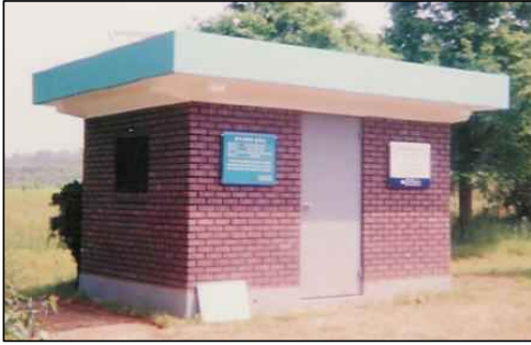
<소규모 건축물 사례>