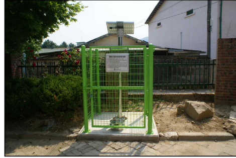
<외장형 단자함 사례>