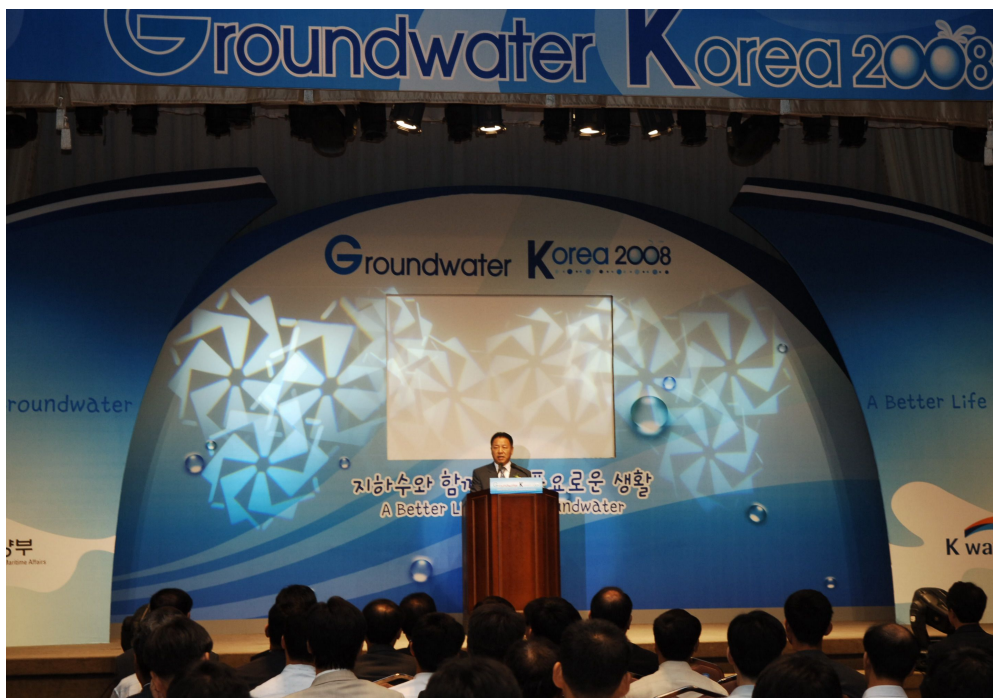
개회사 (한국수자원공사 사장)