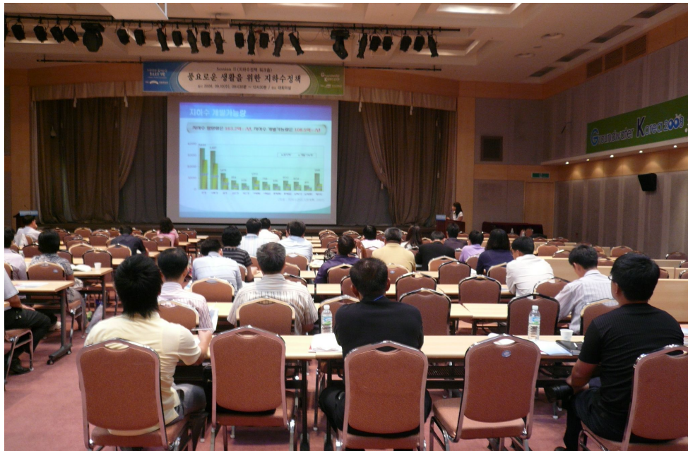
지하수 정책 워크숍