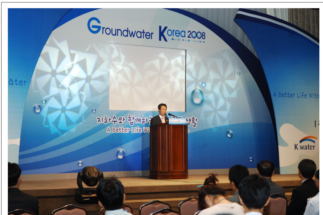
치사 (국토해양부 차관)