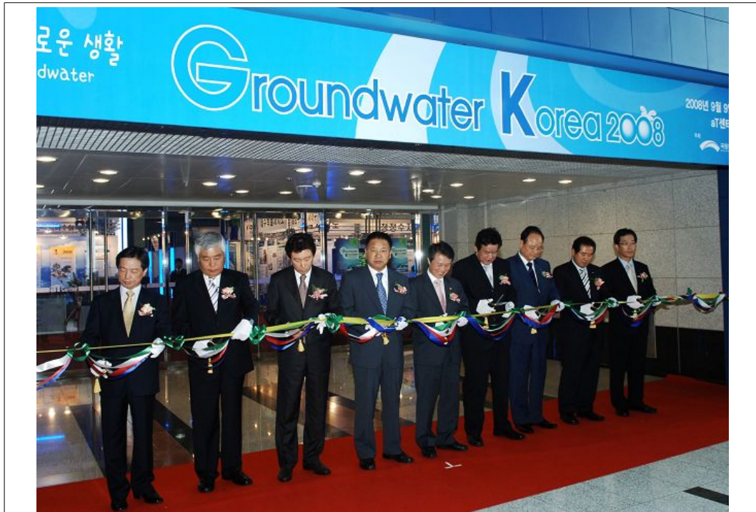
전시회 테일 커팅식